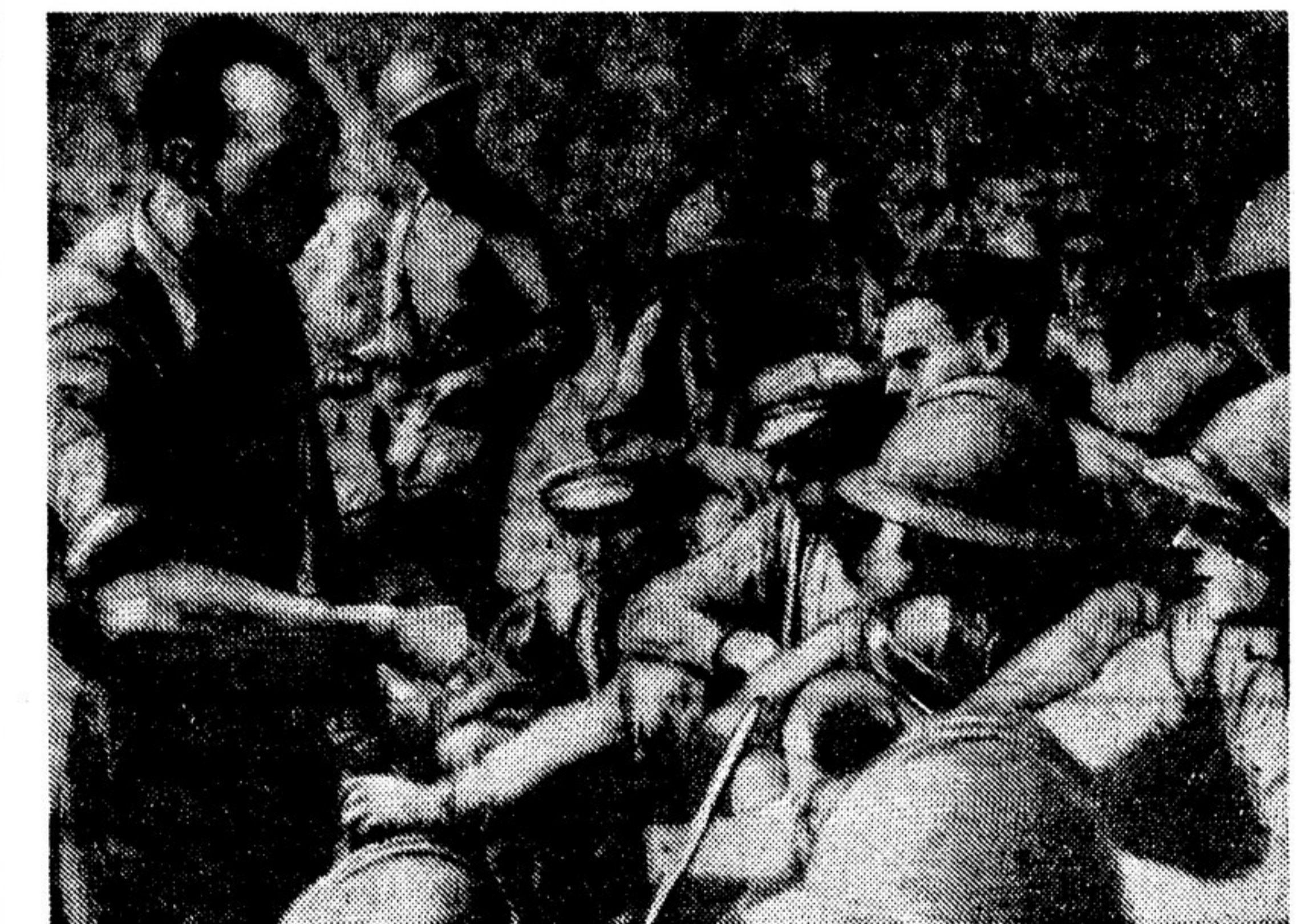
Собрание бойцов Интернациональной бригады. Фото из альбома «Год интернациональных бригад».