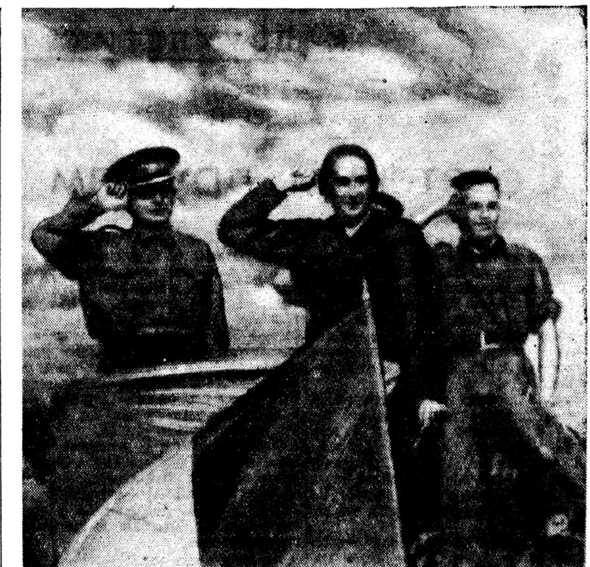
Долорес Ибаррури выступает на митинге бойцов.