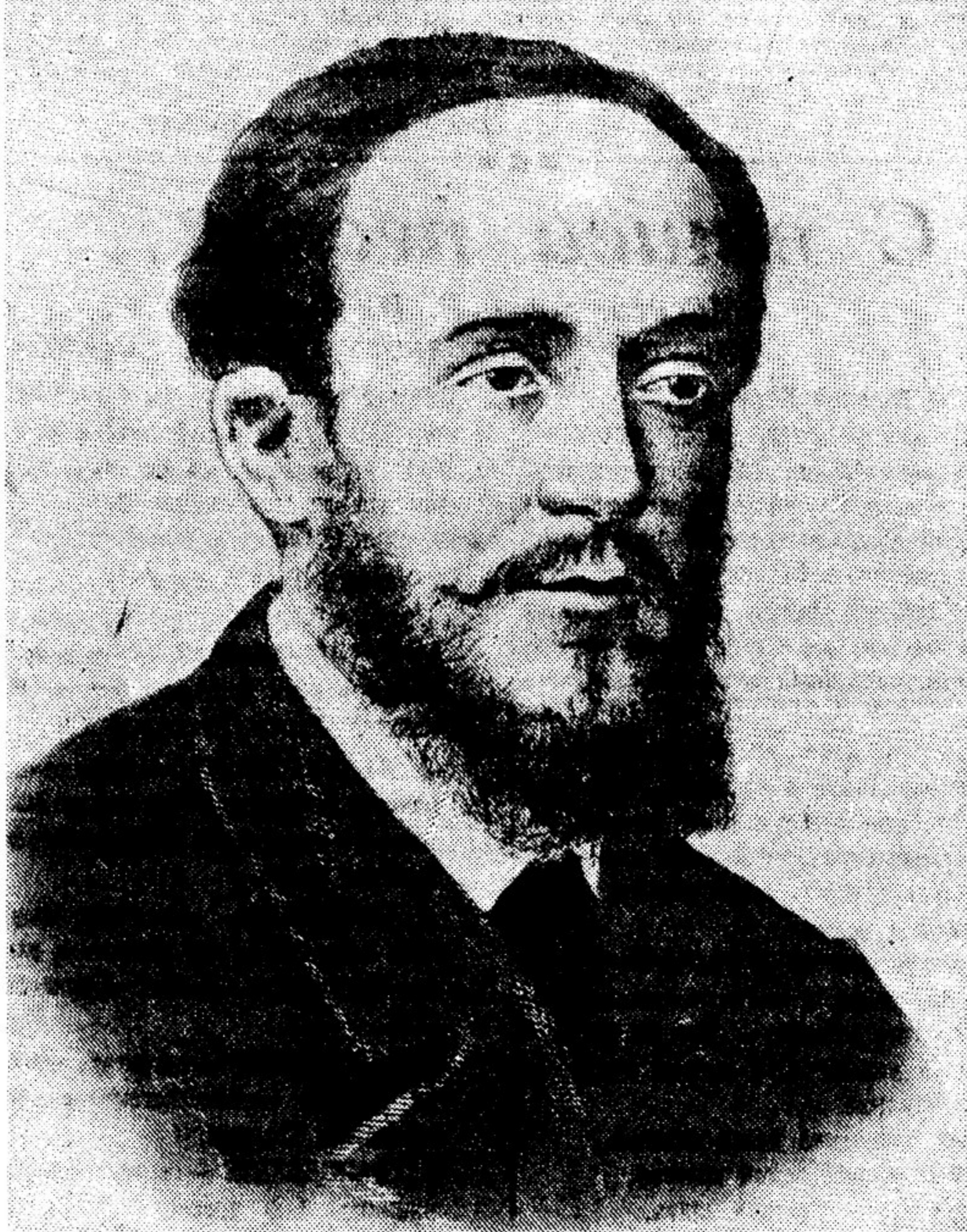
Дмитрий Иванович Писарев.